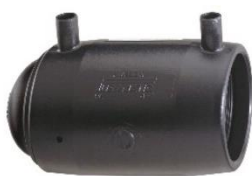
20 t/m 75mm