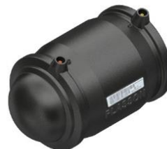
90 t/m 315mm